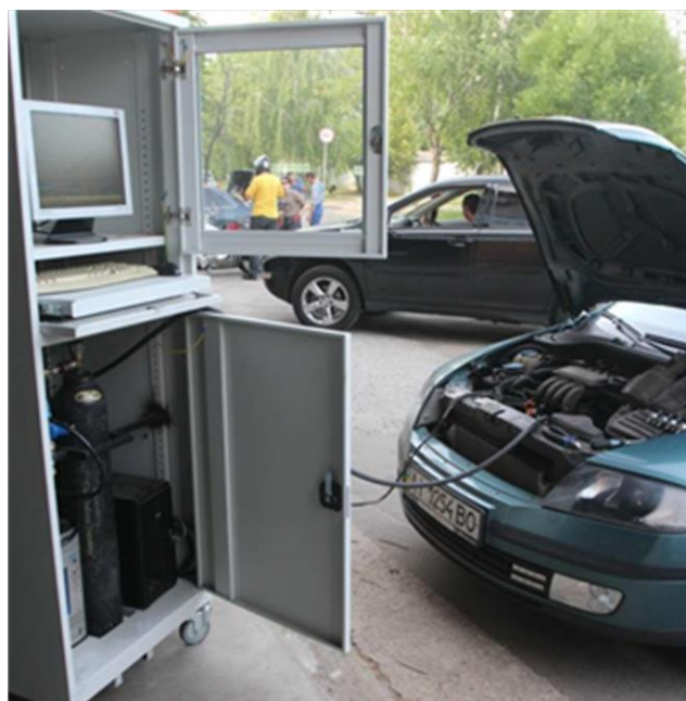
Рисунок 3 – Стенд Дзагидзе для проверки газовых форсунок

нащен узлом подачи чистящей жидкости для промывки инжекторов.