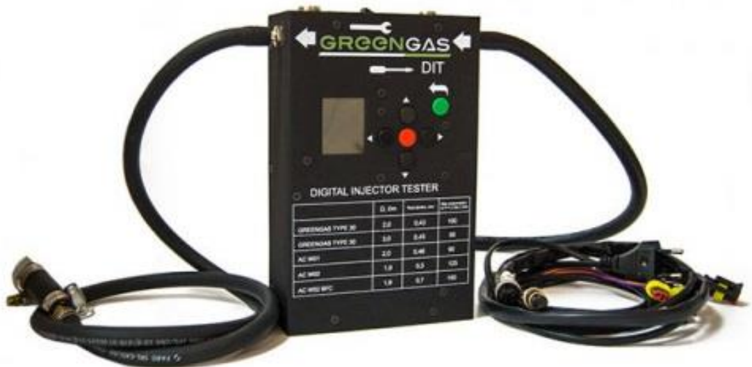
Рисунок 2 – Digital Injector Tester от компании "GreenGas"

Также известен стенд «Digital Injector Tester» от компании «GreenGas», более узнаваемый под названием «ЭДИК», который, как и стенд от фирмы «ELPIGAZ», позволяет измерить относительную производительность газовых форсунок при установленной длительности впрыска, с тем отличием, что измерение проводится для четырёх инжекторов одновременно, а результат выводится на цифровой дисплей в виде процентного отклонения производительности форсунок относительно принятой за опорную (рис. 2)[9].