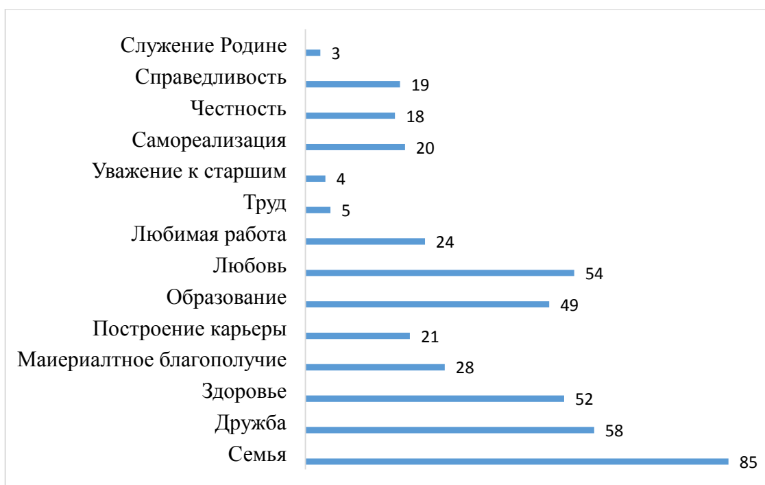
Рис. 1. Ответы на вопрос «Что для Вас наиболее значимо в жизни?», в %

Прежде всего, хотелось определить, какие ценности лежат в основе поведения молодых людей. Результаты исследования показали, что на первом месте в системе ценностных ориентаций молодежи Краснодарского края оказались семья, дружба, любовь, здоровье (рис. 1). Такие ценности, как ценность материального благополучия, любимая работа и т.д. выбирали значительно меньшее количество респондентов. Интересным данный факт представляется в силу того, что ряд ценностей, определявших вектор жизни советских людей, таких как труд, уважение к старшим, служение Родине сегодня имеют критически низкую степень важности для опрошенной молодежи. Эта ситуация свидетельствует о том, что ценность труда утрачивает сегодня свою значимость и воспринимается лишь как инструмент для достижения определенных жизненных целей.